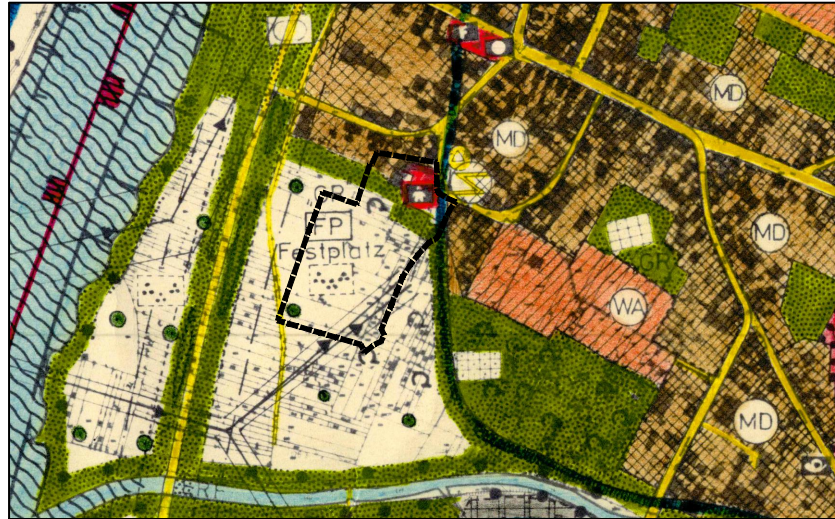
FLÄCHENNUTZUNGSPLAN M. ca. 1 : 2.500 BESTAND